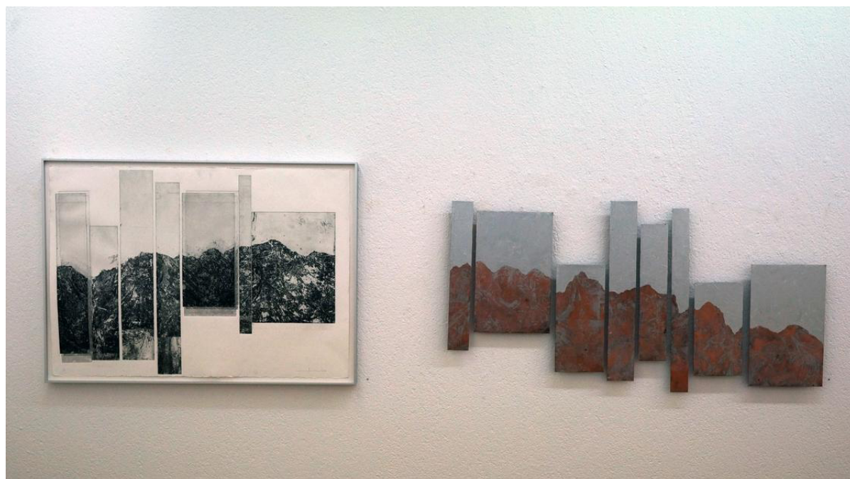
Madlaina Fontana: Bergsturz, 2017, Plastikdruck und Ätzung; Silber-Berge, 2018, Kupferplatten-Ätzung.